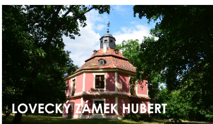
LOVECKÝ ZÁMEK HUBERT