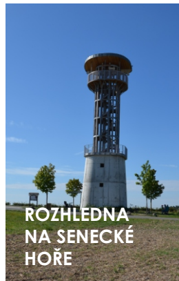
ROZHLEDNA NA SENECKÉ HOŘE

21.5 m vysoká rozhledna byla vystěhována v letech 2014 - 2015 a je z ní krásný výhled na Doupovské hory, Krušné hory či České středohoří.